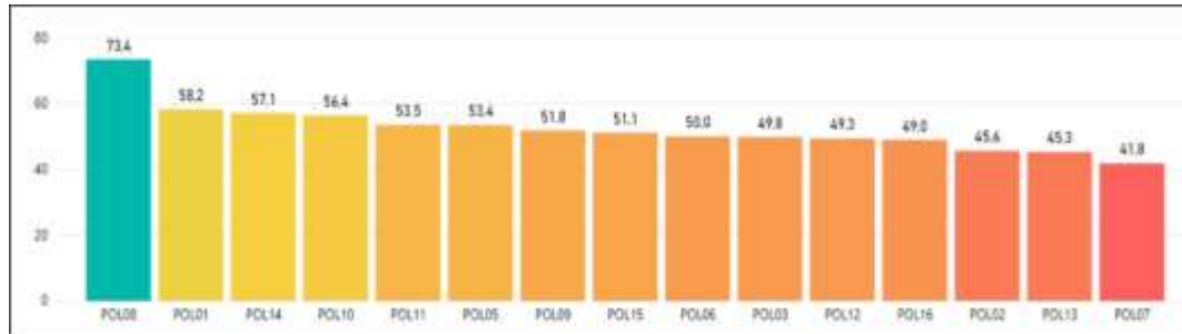
Gráfica resultados del IDI de las políticas del MIPG vigencia 2019 – Función Pública

Las políticas se muestran en la gráfica de acuerdo a su mayor porcentaje de gestión, los colores representan un ranking según los puntajes obtenidos. No necesariamente determinan un alto o bajo desempeño.