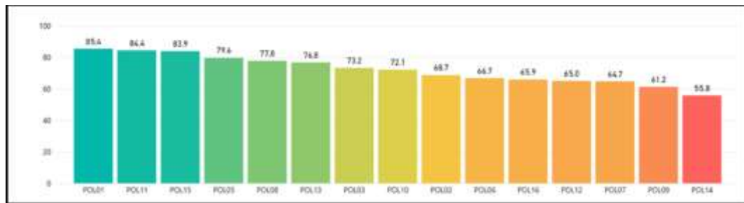
Gráfica resultados del IDI de las políticas del MIPG vigencia 2020 – Función Pública

Las políticas están definidas en la Gráfica así: