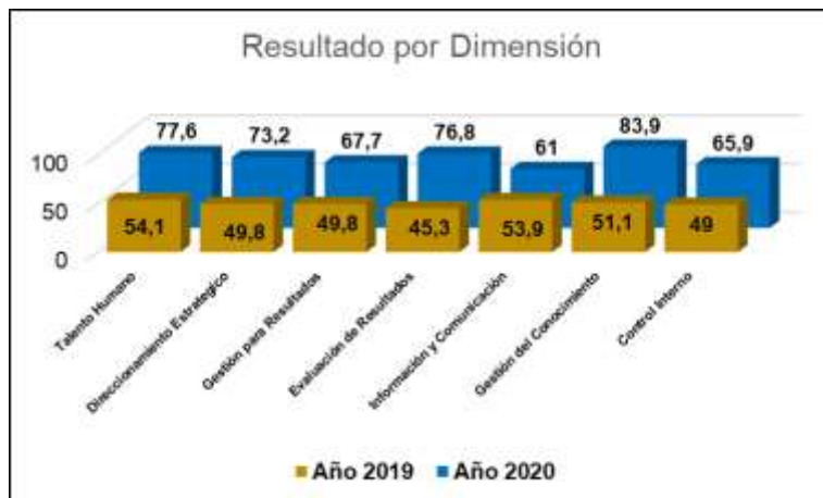
Gráfica comparativo porcentaje de calificación IDI por Dimensión 2019-2020

Para las dimensiones se observa una variación en cada una de ellas, teniendo como resultado para la vigencia del 2020 con relación al 2019 un incremento en cada una de las siete dimensiones, como lo podemos apreciar en la siguiente gráfica.